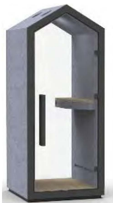
THS 1T G2